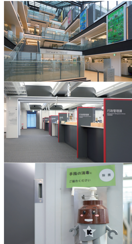
2020年3月に完成した第一本庁舎は、災害に強く、環境にやさしく、誰もが利用しやすい庁舎。川口市のマスコットキャラクター「きゅぼらん」の消毒液カバーは職人による手作り

えました。こうした業務は予算に計上されていないことがほとんどですので、もし外部委託をするなら予算の調整や委託先の検討・契約などの手続きに一定の時間がかかってしまいます。一方、AI-OCRやRPAで自動化できれば、すぐに対応を始められますし、業務によっては外部委託よりコストを抑えられます。市役所の業務には個人情報を取り扱うものが多いですが、内製化なら外部とデータのやりとりが発生せず、情報漏洩のリスクを軽減できるメリットもあります。